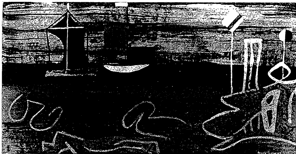
Schiffe und Seezeichen (32)